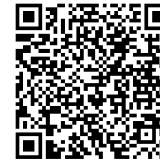
QR-Code der Anmeldeseite

Es gelten die Teilnahmebedingungen für Fortbildungsveranstaltungen der Landesärztekammer Brandenburg, veröffentlicht unter www.laekb.de .