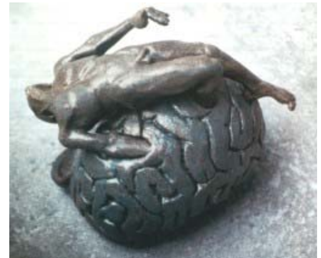
Bodo Wentz: Fallsucht I (Keramik 1983) Deutsches Epilepsiemuseum Kork

Campus Benjamin Franklin Campus Charité Mitte Campus Virchow-Klinikum